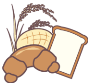
不吃小麦。 小麦がだめ