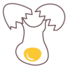
不吃鸡蛋。 卵がだめ