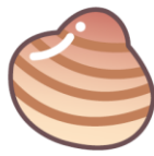
不吃贝类。 貝がだめ