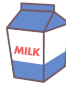
不喝牛奶。 牛乳がだめ