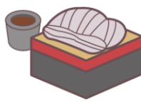
不吃荞麦面。 そばがだめ