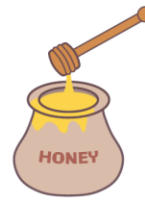
不吃蜂蜜。 ハチミツがだめ