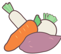
不吃根菜类。 根菜類がだめ