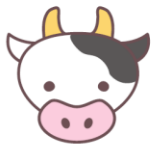
不吃牛肉。 牛がだめ