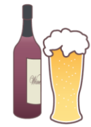
不饮酒。 アルコールがだめ